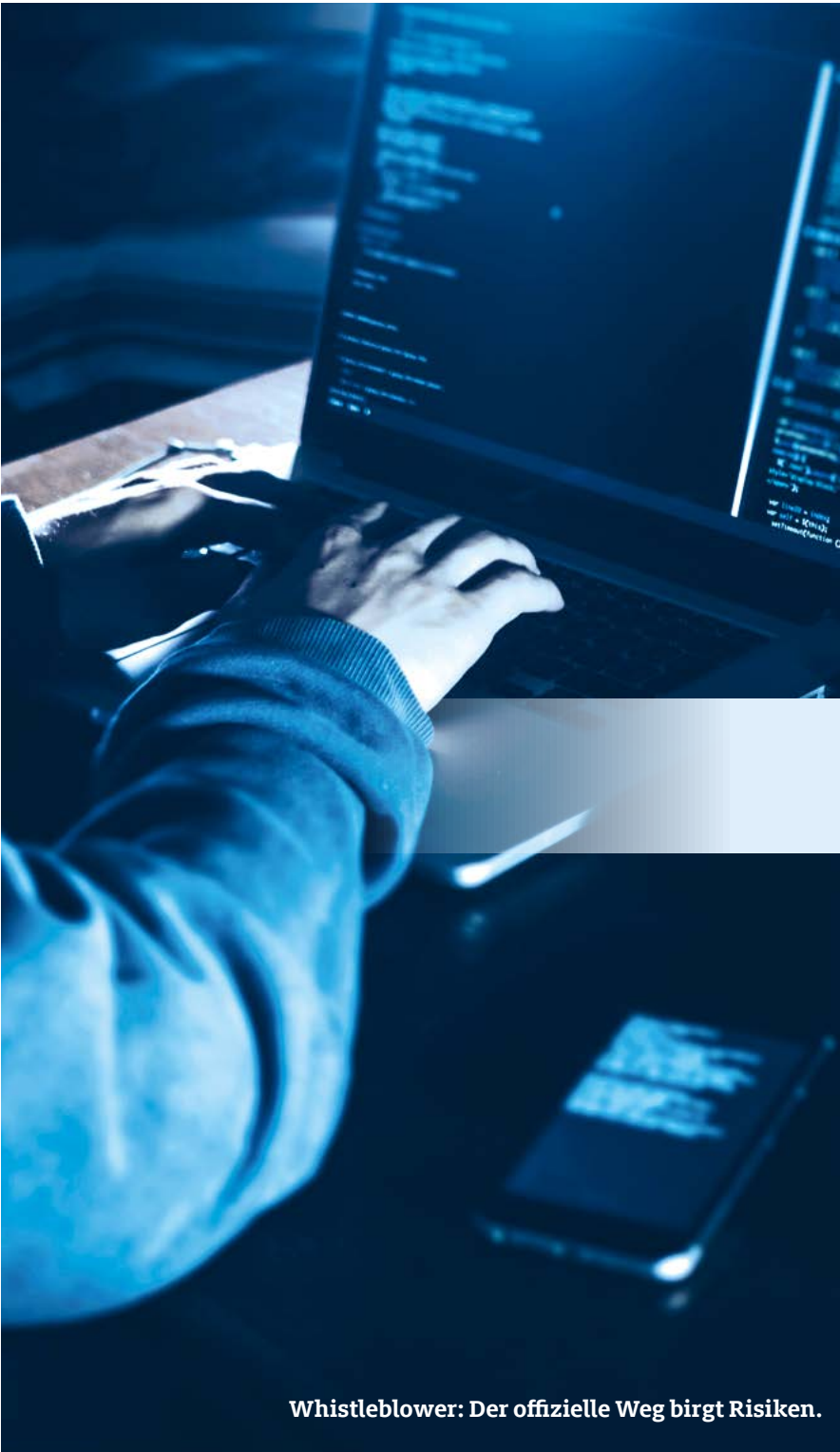
Whistleblower: Der offizielle Weg birgt Risiken.