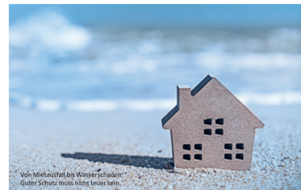
Von Mietausfall bis Wasserschaden: Guter Schutz muss nicht teuer sein.

Guter Schutz muss nicht teuer sein, eine Ferienappartement-Versicherung gegen die Gefahren Feuer, Einbruchdiebstahlversicherung, Leitungswasser und Sturm mit einer Betriebsunterbrechungsversi-