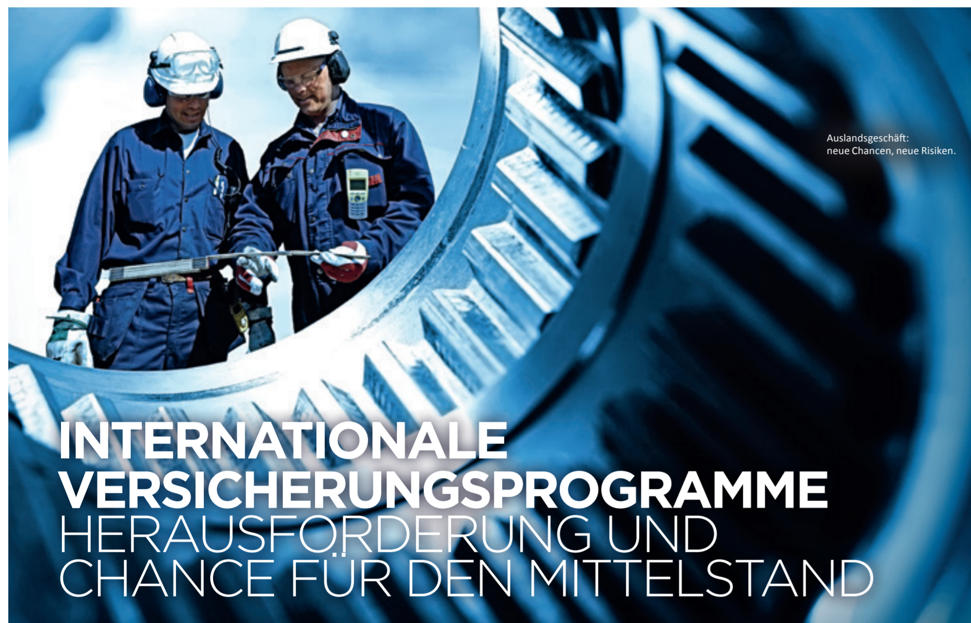
Auslandsgeschäft: neue Chancen, neue Risiken.