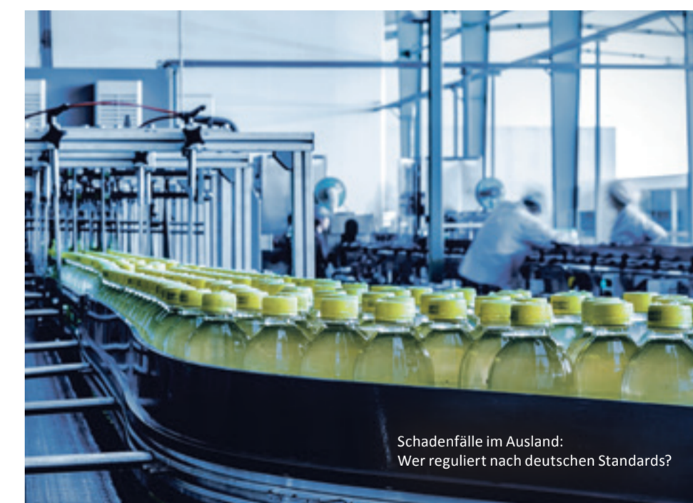
Schadenfälle im Ausland: Wer reguliert nach deutschen Standards?

Leider sind nicht alle in Deutschland zugelassenen Versicherer in der Lage, internationale Versicherungsprogramme aufzulegen und zu administrieren. Das