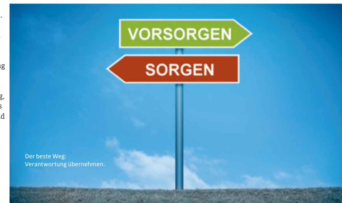
Der beste Weg: Verantwortung übernehmen.

aus Riester- oder Basisrentenversicherungen – nicht vollständig auf eine etwaige Grundsicherung im Alter angerechnet. Aktuell ist ein Sockelbetrag von monatlich 100 Euro sowie 30 % des diesen übersteigenden Teils der Altersrente aus der