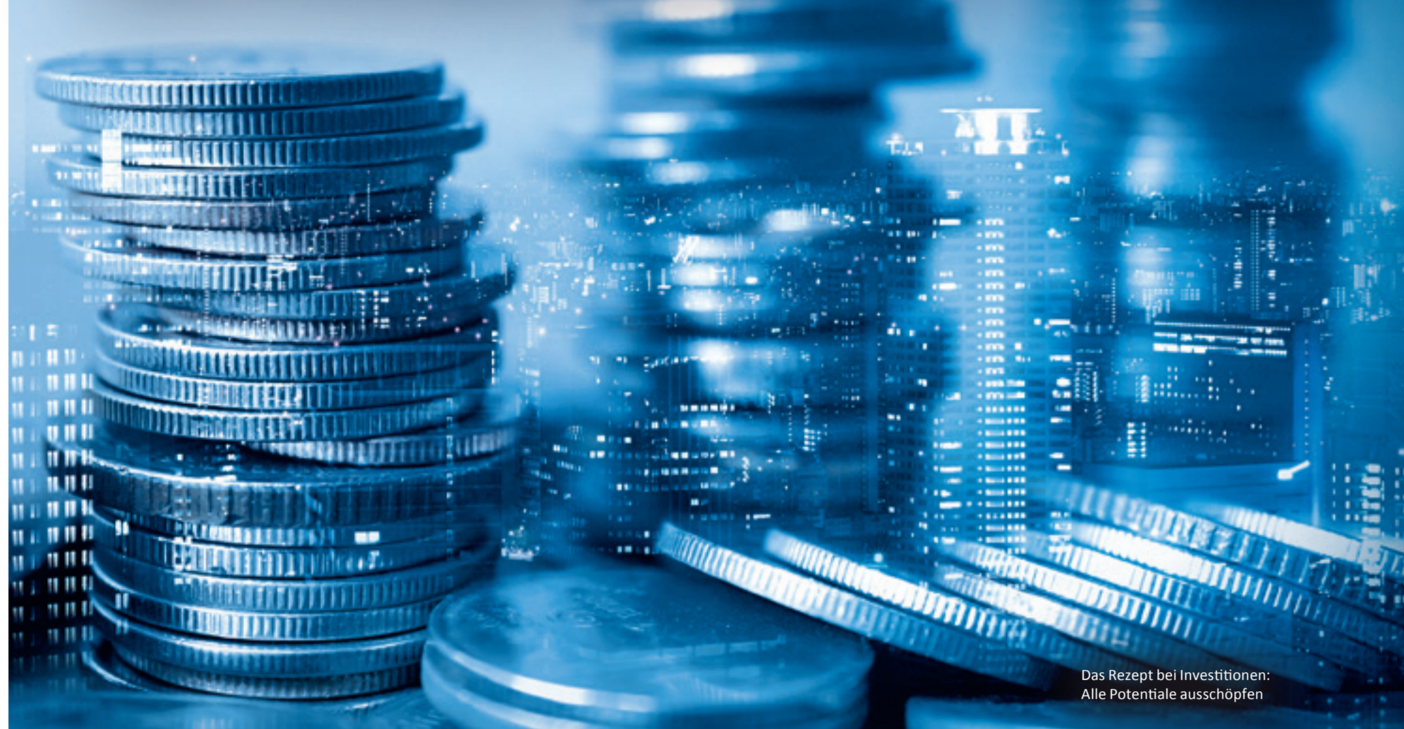
Das Rezept bei Investitionen: Alle Potentiale ausschöpfen

Finanzierungen stehen bei jedem – ob gewerblich oder privat – über kurz oder lang an. Neue Maschinen, ein neuer Fuhrpark, eine Büro-Immobilie, eine Lagerhalle oder das private Eigenheim – ein Projekt dieser Art ist bei jedem im Laufe der Zeit einmal in der Planung.