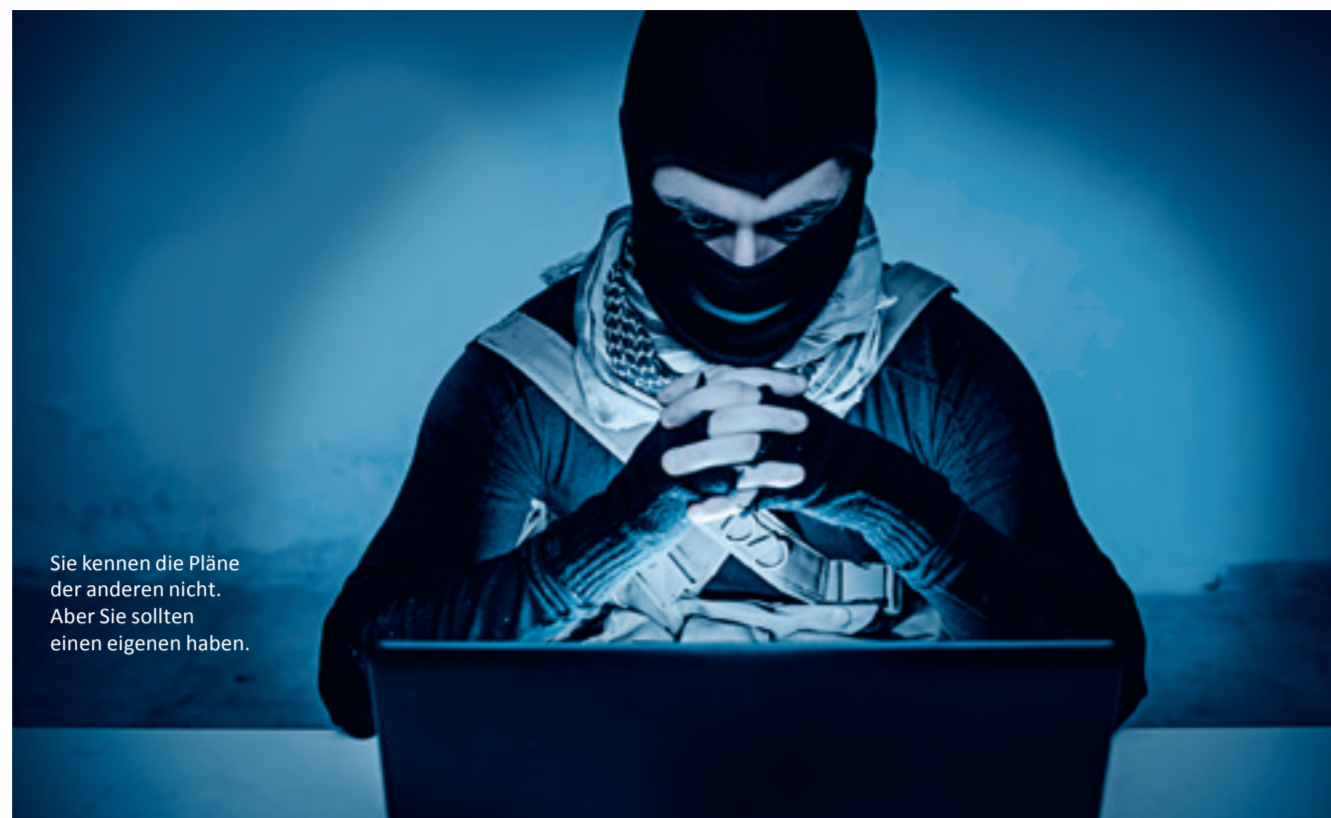
Sie kennen die Pläne der anderen nicht. Aber Sie sollten einen eigenen haben.

In Deutschland beispielsweise wurde im Jahr 2002 als Folge des oben genannten Ausschlusses der Spezialversicherer EXTREMUS Versicherungs-AG gegründet, der eine Absicherung durch eine Kombination von privatwirtschaftlicher Haftung und Staatsgarantie anbietet.